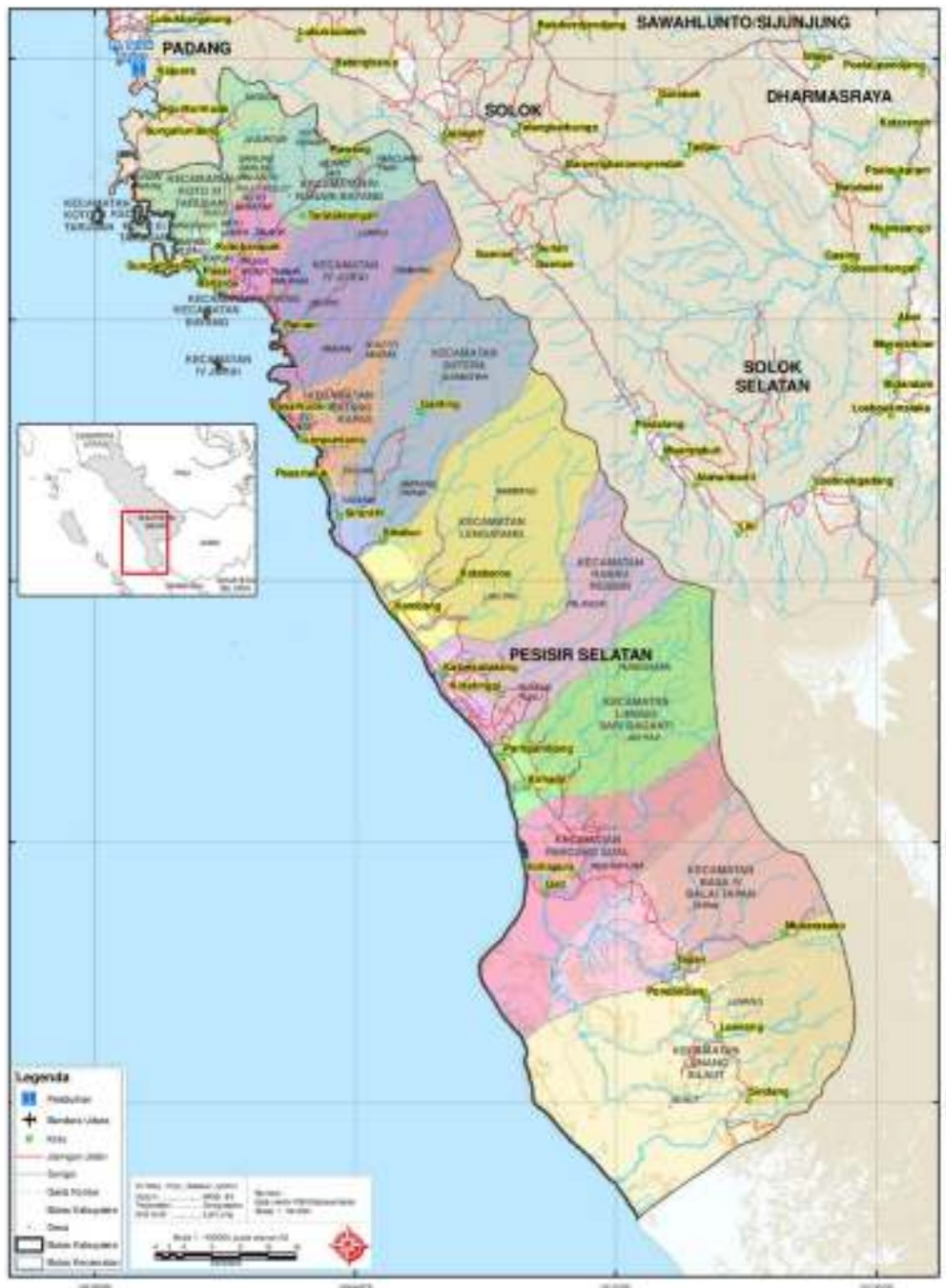
Gambar 1. Peta Administratif Kabupaten Pesisir Selatan

Sebagian besar wilayah Kabupaten Pesisir Selatan masih berupa hutan lebat, yaitu sekitar 61,88% dari total wilayah kabupaten. Distribusi pemanfaatan lahan di Kabupaten Pesisir Selatan dapat dilihat pada Tabel 2. Kondisi tersebut menyebabkan potensi sumber daya alam yang ada di Kabupaten Pesisir Selatan memiliki berbagai variasi intensitas dan penggunaannya.