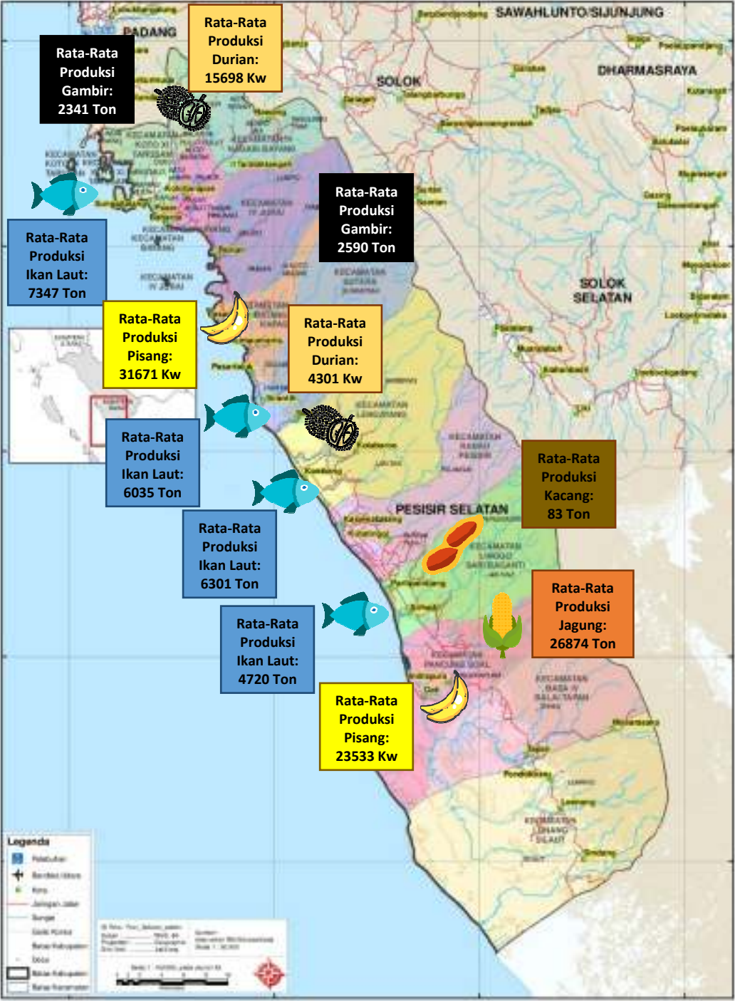
Gambar 5. Peta Potensi Bahan Baku di Kabupaten Pesisir Selatan